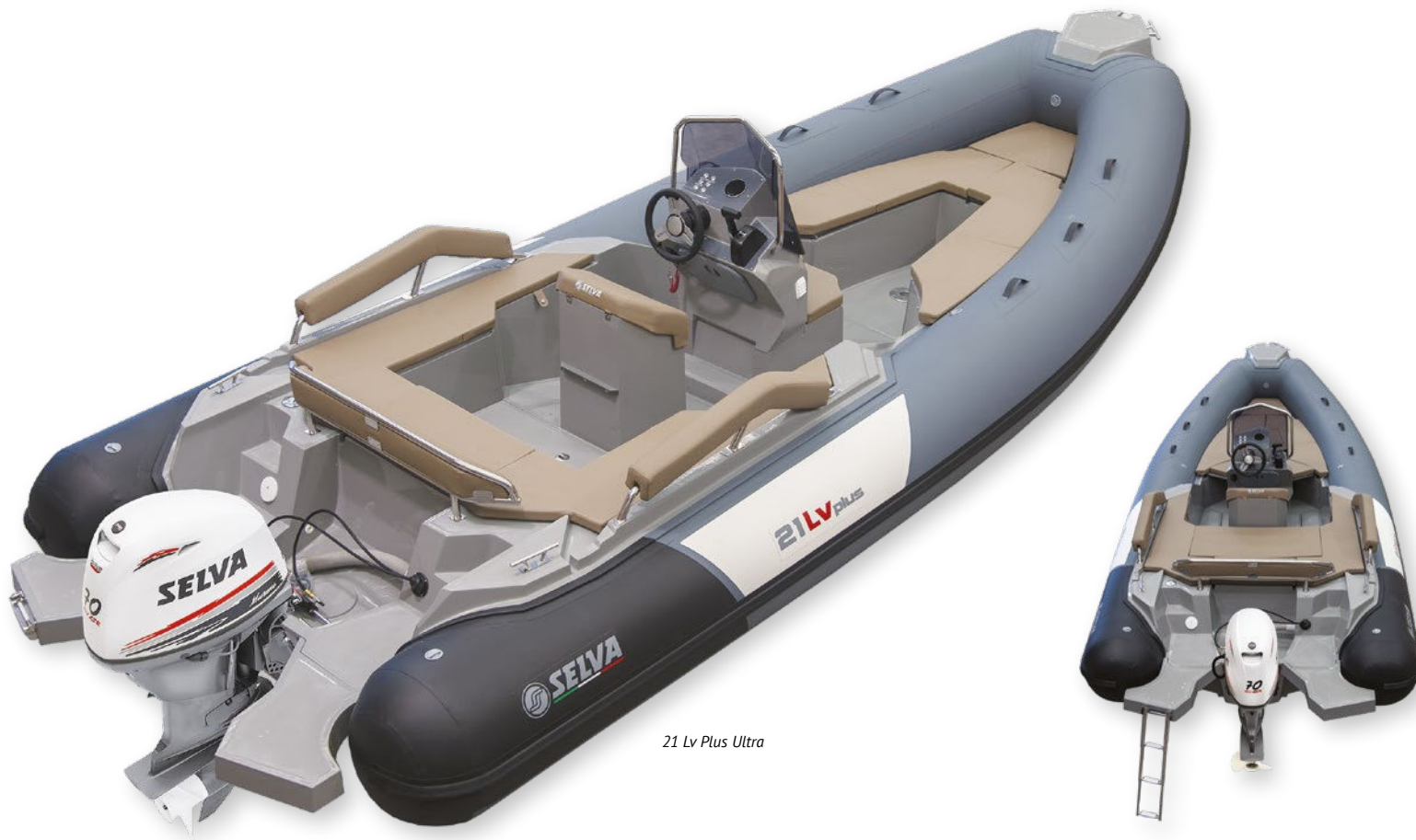
21 Lv Plus Ultra