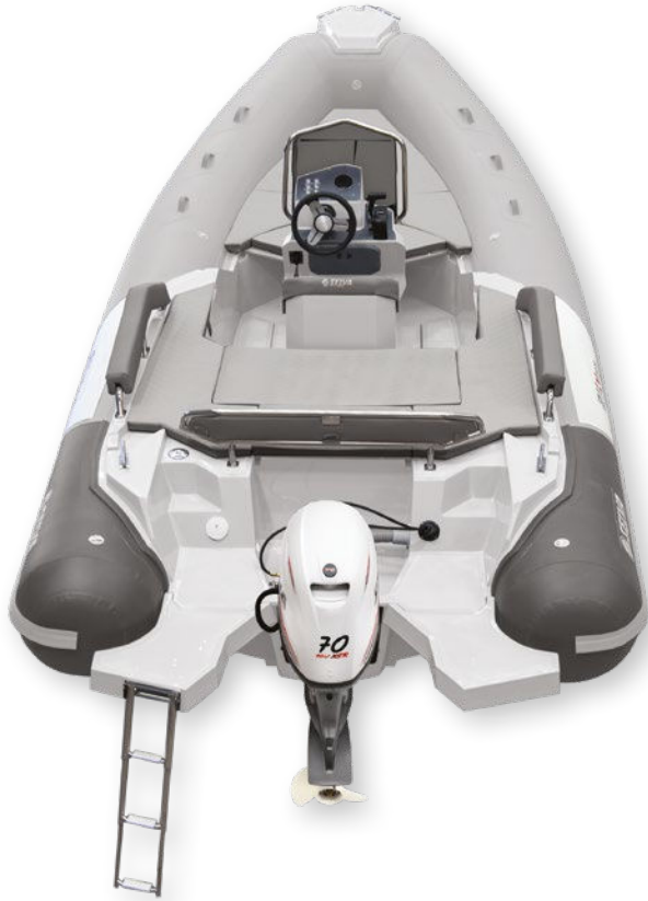
21 LV Plus