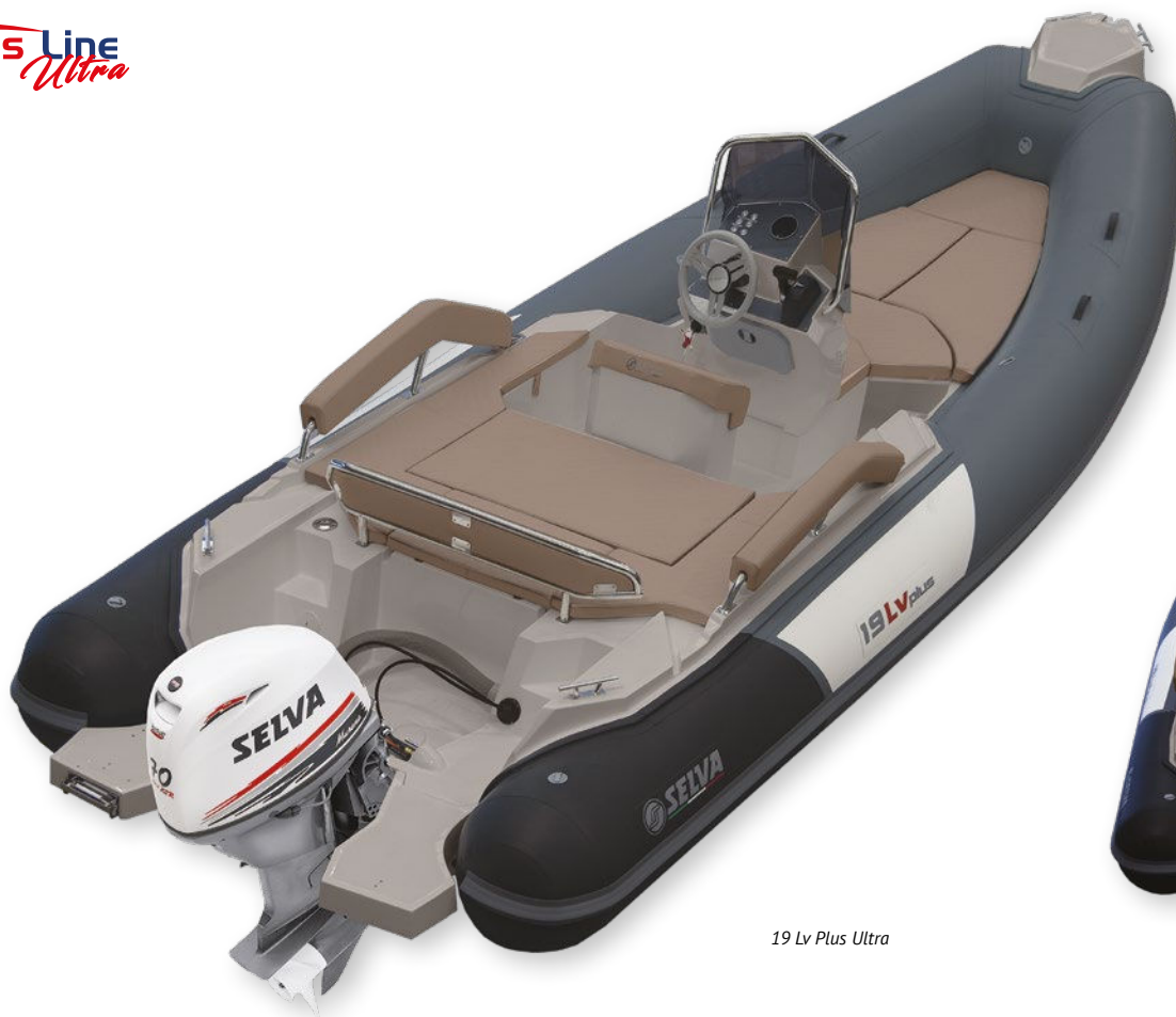
19 Lv Plus Ultra