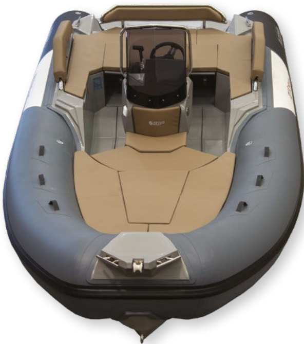
21 LV Plus Ultra